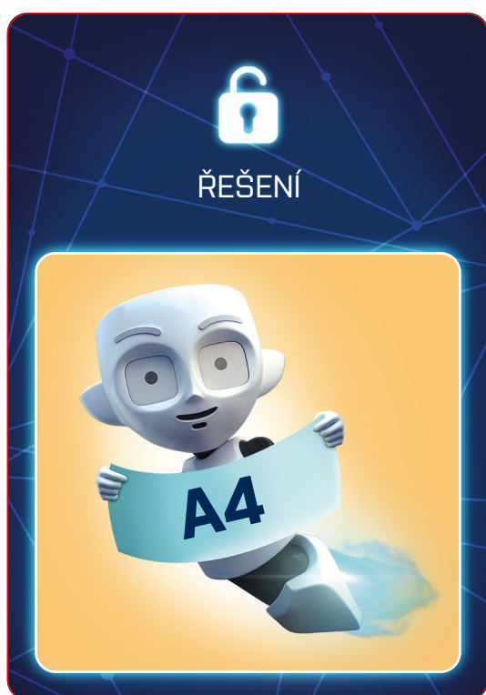
karta 7 Správné řešení úlohy je A4 (místo B4)