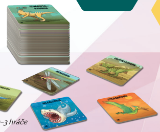
Příprava hry pro 2-3 hráče

Ostatní karty odložte stranou, také obrázky zvířat nahoru, budou tvořit dobírací balíček. Na stůl připravte hromádku bodovacích žetonů a čtyři kostky.