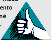
Sázka na tutovku

Tento žeton může jeho majitel využít v kterýkoliv moment hry, pokud není zrovna na řadě. S jeho pomocí si může vsadit na hráče, který je právě na řadě. Pokud tento hráč odpoví správně, sázející vydělá společně s ním příslušný obnos. V případě špatné odpovědi sázející hráč prohraje příslušný obnos. (Pokud momentálně žádné peníze nemá, neprohrává nic.)